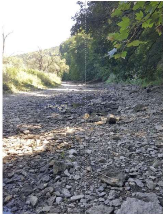
Totale Donauversickerung bei Immendingen (Brühlwiesen)