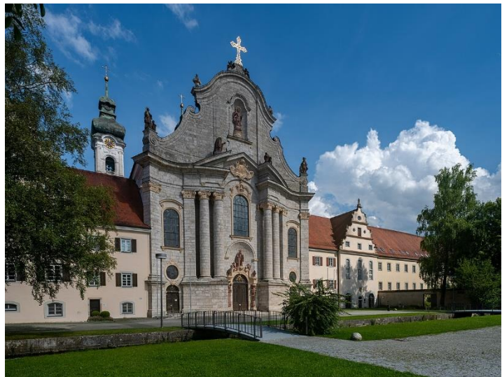
Klosterkirche Zwiefalten aus Gauinger Travertin