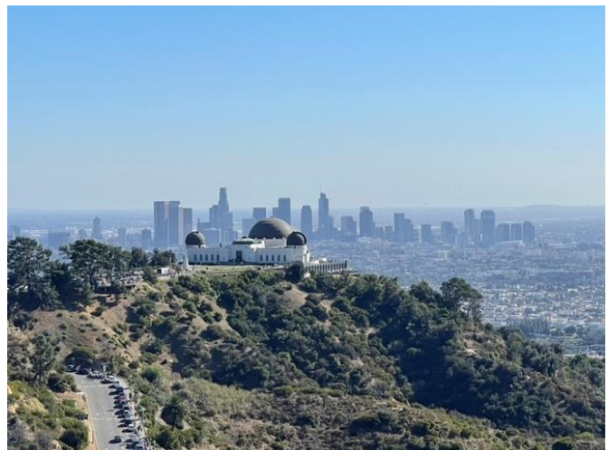
© R. Schick 2023 (Griffith Observatorium, Sternwarte in Los Angeles)

Fast überall gibt es Spuren von Vulkanismus, teilweise von gigantischen Dimensionen, und der geologische Bau ist aufgrund der heutigen Lage an einem aktiven Kontinentalrand außerordentlich komplex und vielfältig.